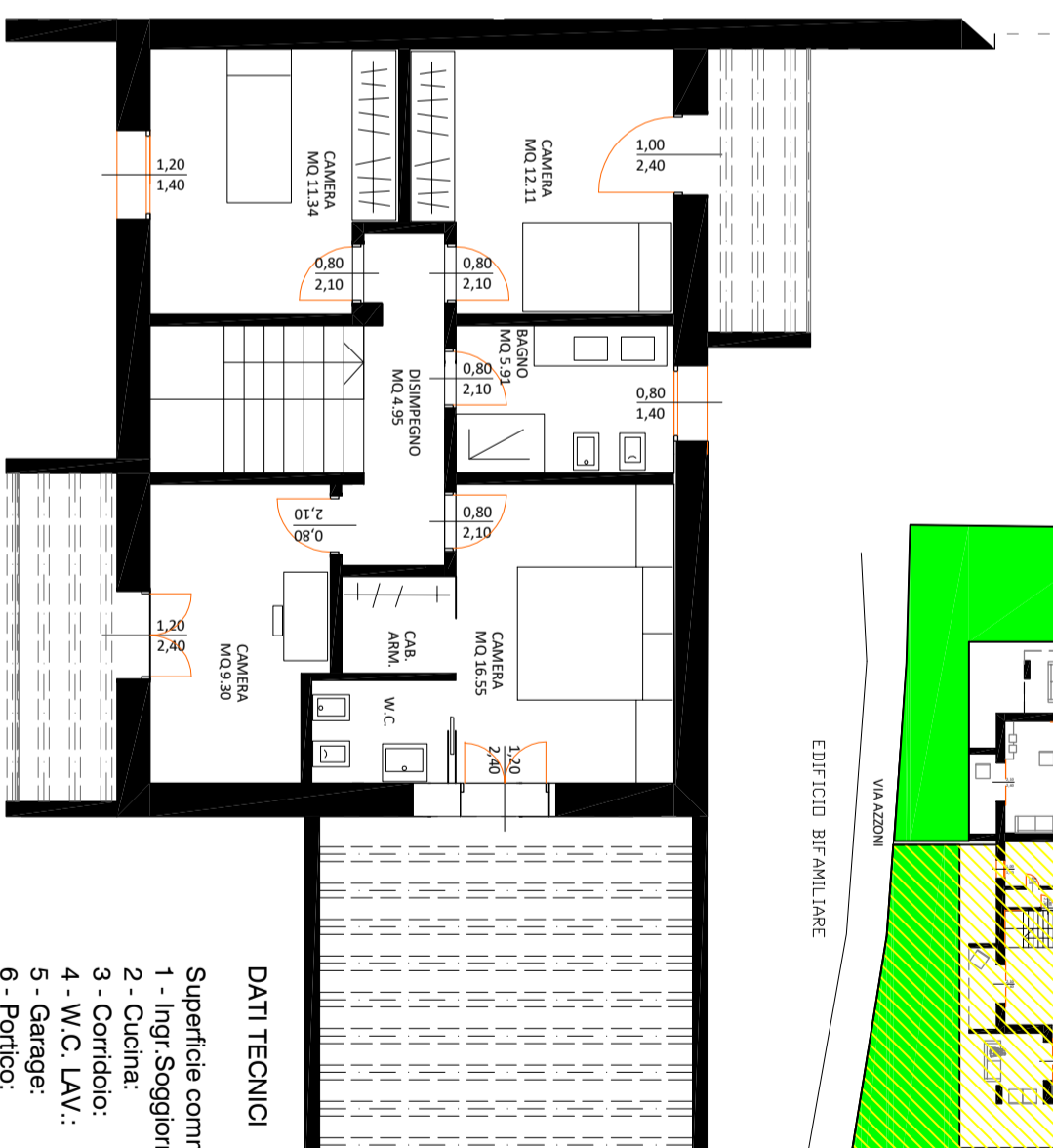
PIANO PRIMO — Scala 1:100